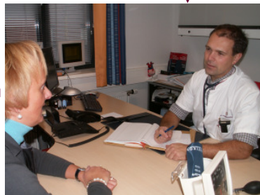
5. 1ste contact cardioloog