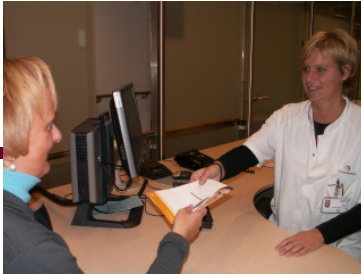
1. polikliniek cardiologie