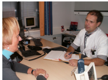
7. 2e contact cardioloog