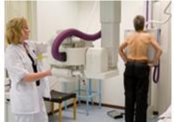
3. Röntgenafdeling 22