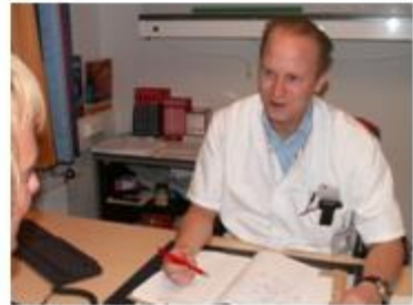
4. Consult cardioloog 08