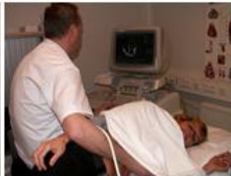
7. Echo van het hart Functieafdeling 09