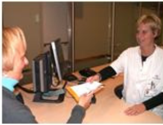
1. polikliniek cardiologie 08