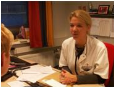
5. Consult longarts 07