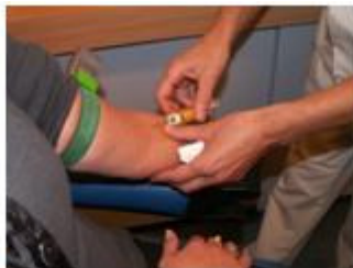
2. Laboratorium 06